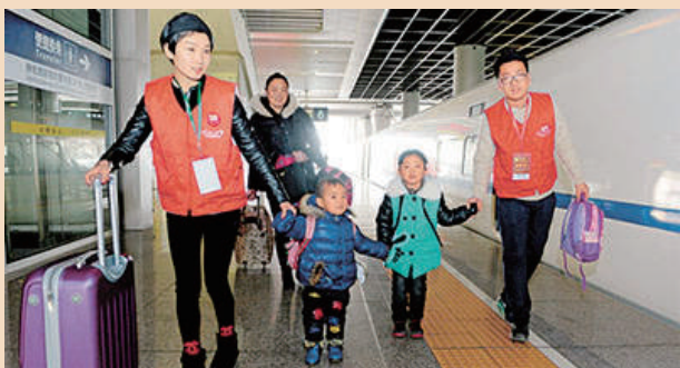
杭州春运志愿者帮助旅客提拿行李并将他们送上火车。