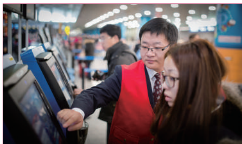
志愿者帮助 旅客办理登机手续