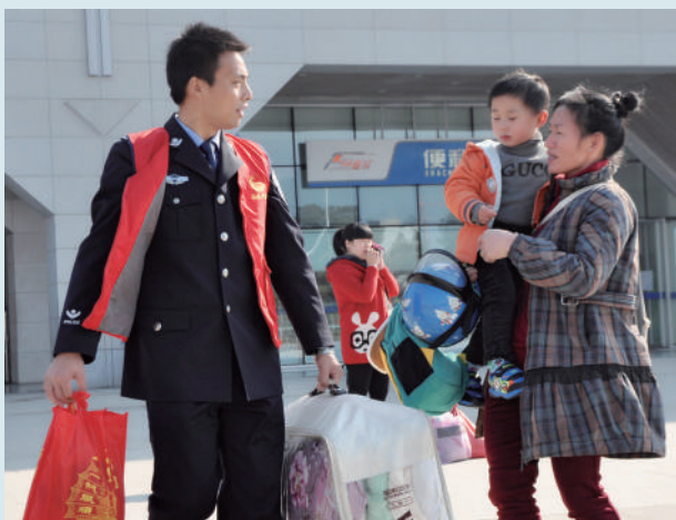
■ 志愿者帮助旅客拎行李

故事发生在年前，一位在外地打工的母亲，带着孩子从外省赶回宁德乡下老家过年。由于从宁德火车站下车，到老家还要再换乘一次汽车，所以在火车站上并没有人来接这位满载行李又带着孩子的妈妈。下了火车以后，川流不息的人群、大包小包的行李以及尚需看护的孩子让她犯了难。若拿了行李就顾不上孩子，顾着了孩子行李却又没有办法移动。正当这位母亲不知所措的时候，我们的春运志愿者发现了这一情况，主动提出帮助提行李。这位母亲的表情一下从茫然转变成了欣喜。身着制服的春运志愿者给这位母亲带来了安全感和信任感。阳光洒在志愿者和这对母子的身上，呈现出了照片中的这一景象。❤