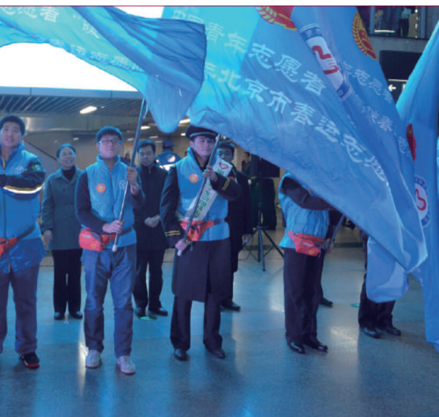
中国青年志愿者服务春运 “暖冬行动”在北京西站启动