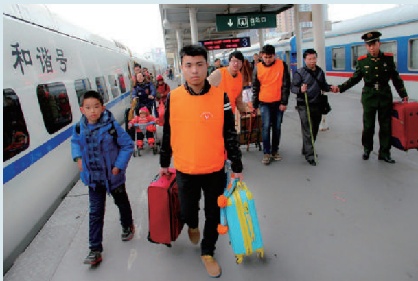
■【湖北】十堰志愿者帮助旅客拎行李