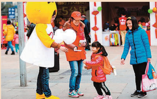
成都铁路局千名青年志愿者“小橙子”暖心上岗，吉祥物“小橙子”与小旅客互动。