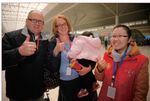
志愿者亲切帮助外国友人