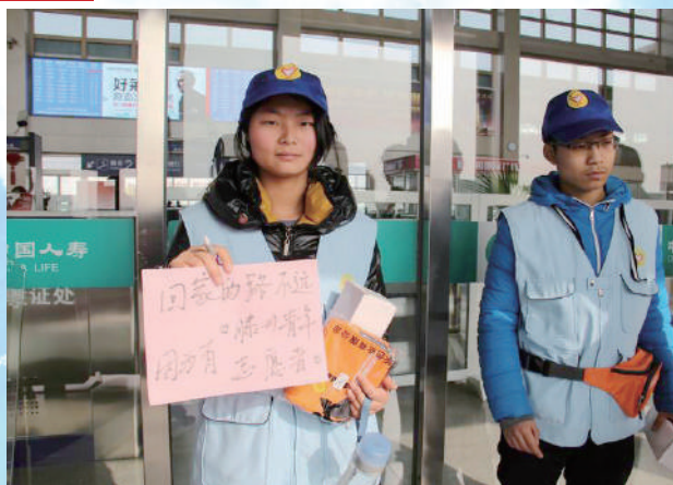
■ 志愿者在车站做服务