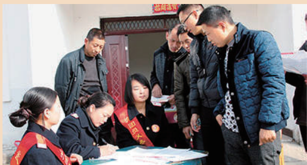
6日上午，武汉铁路局十堰车务段工作人员来到湖北省丹江口市丁家营镇花园村，为该村移民登记信息、发放返程票，让移民返程更加方便。