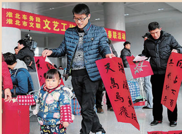
淮北车务段组织书法家们春运送春联，祝福伴归程。

春运开始后，各地青年志愿者按照团中央等部门的部署，以“青春志愿行温暖回家路”为统一主题，开展面向春运旅客的“暖冬行动”。这些志愿者们依托火车站、机场、道路客运站、港口码头、高速公路服务区等场所，主要围绕引导咨询、秩序维护、重点帮扶、便民利民、应急救援等五个方面开展服务。❤