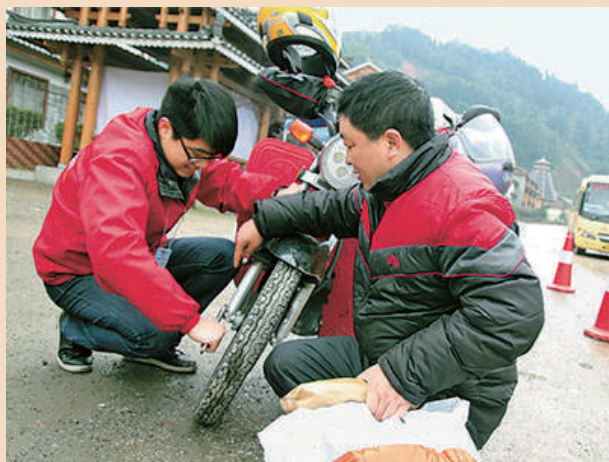
在321国道广西龙胜龙脊段，龙胜大学生西部计划志愿者在协助从广东江门到贵州铜仁的摩托车返乡农民工维修摩托车。