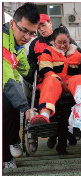
青年志愿者 重点帮扶残障人士